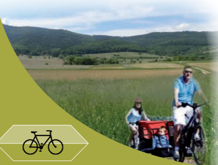
Le Paysage à bicyclette