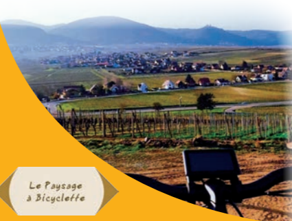
Le Paysage à bicyclette